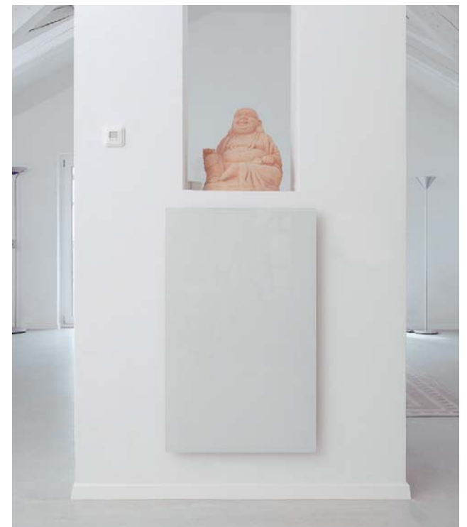
Infraswiss-Heizsysteme verströmen eine wunderbare Wohlfühlwärme, die sofort spürbar ist.

Die Wärmepanels eignen sich für Neu-, An- oder Umbauten oder als Ergänzungsheizung zum Beispiel bei Kachelöfen oder bei Wärmepumpen mit Sperrzeiten oder zur Erwärmung von Bastelräumen, Ateliers, Mansarden etc. Dank unterschiedlicher Grösse und Form finden die Panels überall Platz, selbst in engsten Räumen wie Badezimmer oder Küchen.