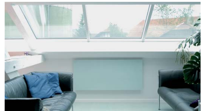
Heizsysteme von Infracswiss verströmen eine wunderbare Wohlfühlwärme, die sofort spürbar ist.

Die Technologie bei Widerstandsheizungen auf Infrarot-Basis ist längst ausgereift, um den Energieverbrauch bei der Wärmeerzeugung auf ein Minimum zu senken. Erstaunlich ist, dass nicht nur bei Neubauten mit einer Infracswiss-Heizung der Energieverbrauch drastisch gesenkt werden kann, sondern dass auch die Energiesünden bei Altbauten namhaft reduziert werden können. Der minimale Energiebedarf solcher Heizungen kann im Idealfall problemlos über die Jahresproduktion einer Photovoltaik-Anlage gedeckt werden.