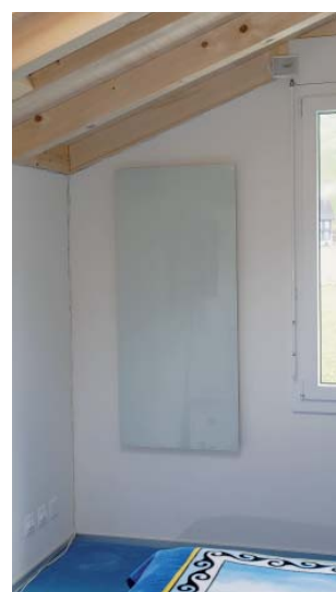
Infrarot-Heizsysteme dienen als vollwertige Heizungs-lösung.